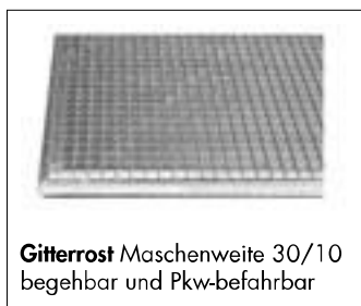
Gitterrost Maschenweite 30/10 begehrbar und Pkw-befahrbar