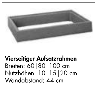
Vierseitiger Aufsatzrahmen Breiten: 60 | 80 | 100 cm Nutzhöhen: 10 | 15 | 20 cm Wandabstand: 44 cm