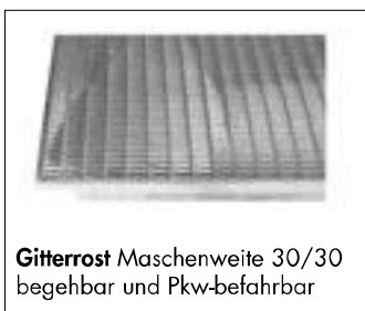
Gitterrost Maschenweite 30/30 begehrbar und Pkw-befahrbar