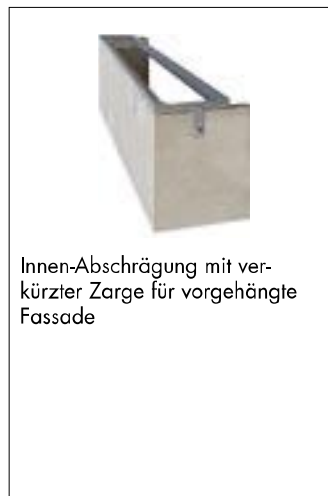
Innen-Abschrägung mit ver- kürzter Zarge für vorgehängte Fassade

Die Anforderungen an die Rostkonstruktion bestimmen wesentlich das Abschlussprofil (z.B. ohne Falz). Bei höheren Verkehrslasten (z.B. SLW30 = 5to Raddruck) kann eine integrierte Unterkonstruktion erforderlich werden. Diese können wir ebenfalls anbieten.