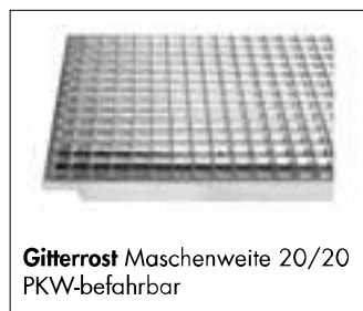
Gitterrost Maschenweite 20/20 PKW-befahrbar