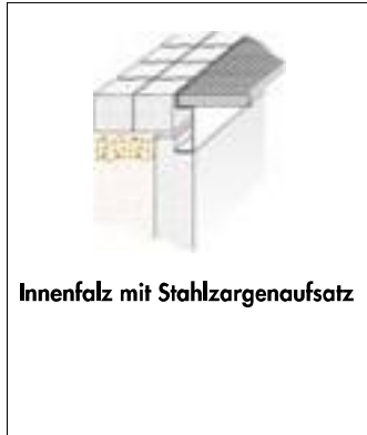
Innenfalz mit Stahlzargenaufsatz