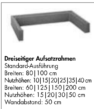
Dreiseitiger Aufsatzrahmen Standard-Ausführung Breiten: 80 | 100 cm Nutzhöhen: 10 | 15 | 20 | 25 | 35 | 40 cm Breiten: 60 | 125 | 150 | 200 cm Nutzhöhen: 15 | 20 | 30 | 50 cm Wandabstand: 50 cm