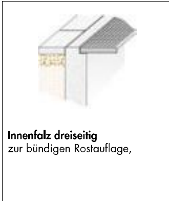
Innenfalz dreiseitig zur bündigen Rostauflage,