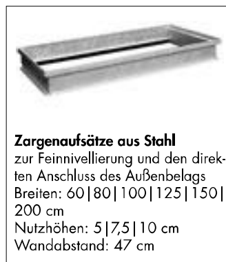
Zargenaufsätze aus Stahl zur Feinnivellierung und den direkten Anschluss des Außenbelags Breiten: 60 | 80 | 100 | 125 | 150 | 200 cm Nutzhöhen: 5 | 7,5 | 10 cm Wandabstand: 47 cm

Mit den Mauthe Aufsatzrahmen Gitterrosten sowie dem darauf abgestimmten Zubehör können die Lichtschächte den Erfordernissen der Praxis angepaßt werden.