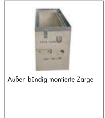
Außen bündig montierte Zarge