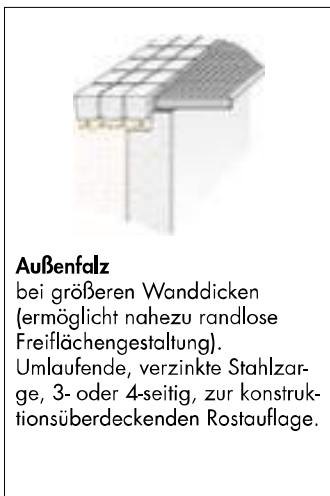
Außenfalz bei größeren Wanddicken (ermöglicht nahezu randlose Freiflächengestaltung). Umlaufende, verzinkte Stahlzarge, 3- oder 4-seitig, zur konstruktionsüberdeckenden Rostauflage.