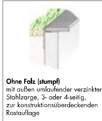
Ohne Falz (stumpf) mit außen umlaufender verzinkter Stahlzarge, 3- oder 4-seitig, zur konstruktionsüberdeckenden Rostauflage