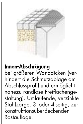
Innen-Abschrägung bei größeren Wanddicken (verhindert die Schmutzablage am Abschlussprofil und ermöglicht nahezu randlose Freiflächengestaltung). Umlaufende, verzinkte Stahlzarge, 3- oder 4-seitig, zur konstruktionsüberdeckenden Rostauflage.